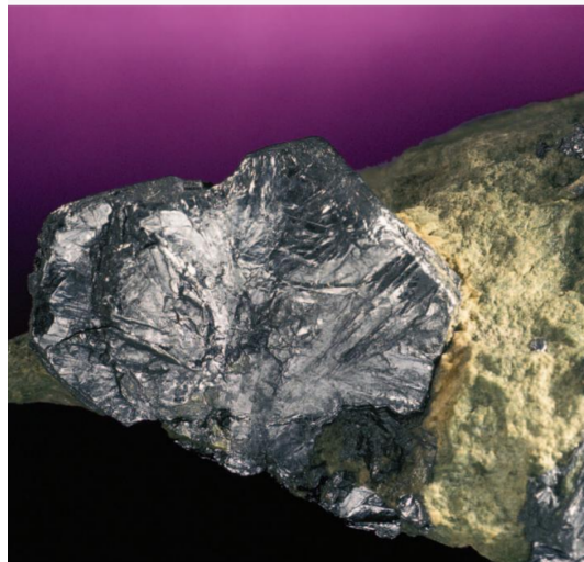
«Gualba», Gualba (Vallès Oriental). A. c. 52 mm. Col. MMC.