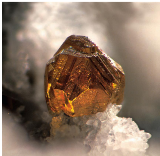
«Berta», el Papiol - Sant Cugat (Baix Llobregat - Vallès Occidental). Cristall de 4 mm. Col. Josep Jurado.