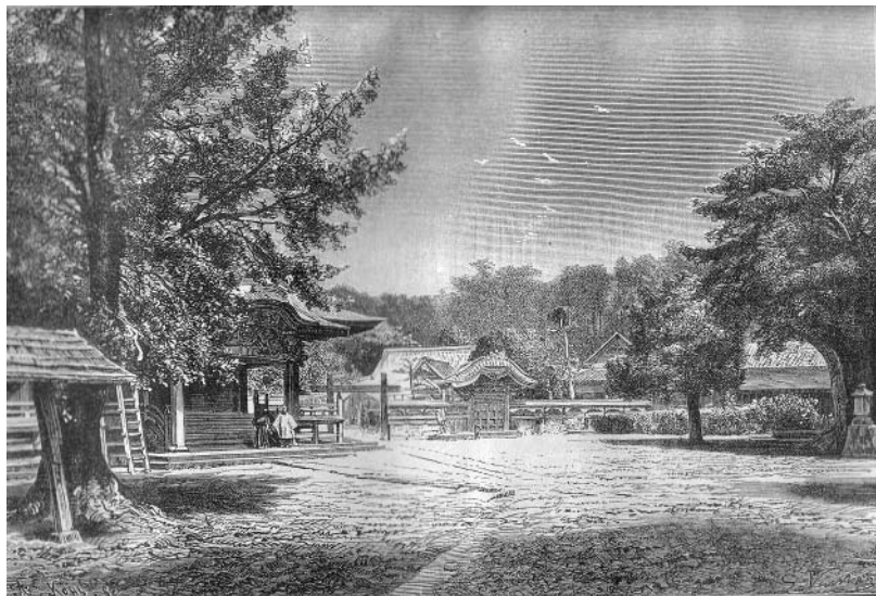
PAYSAGE JAPONAIS. — VUE PRISE A FUZISAWA

Dessin de G. Vullier, d'après une photographie.