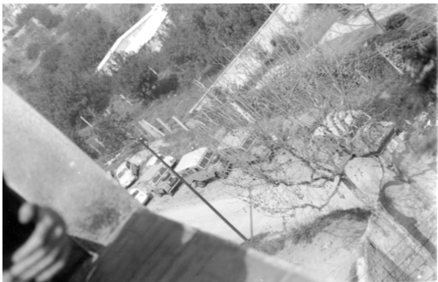
Filera de vehicles de la policia estacionats a les rodalies del convent dels pares caputxins de Sarrià.