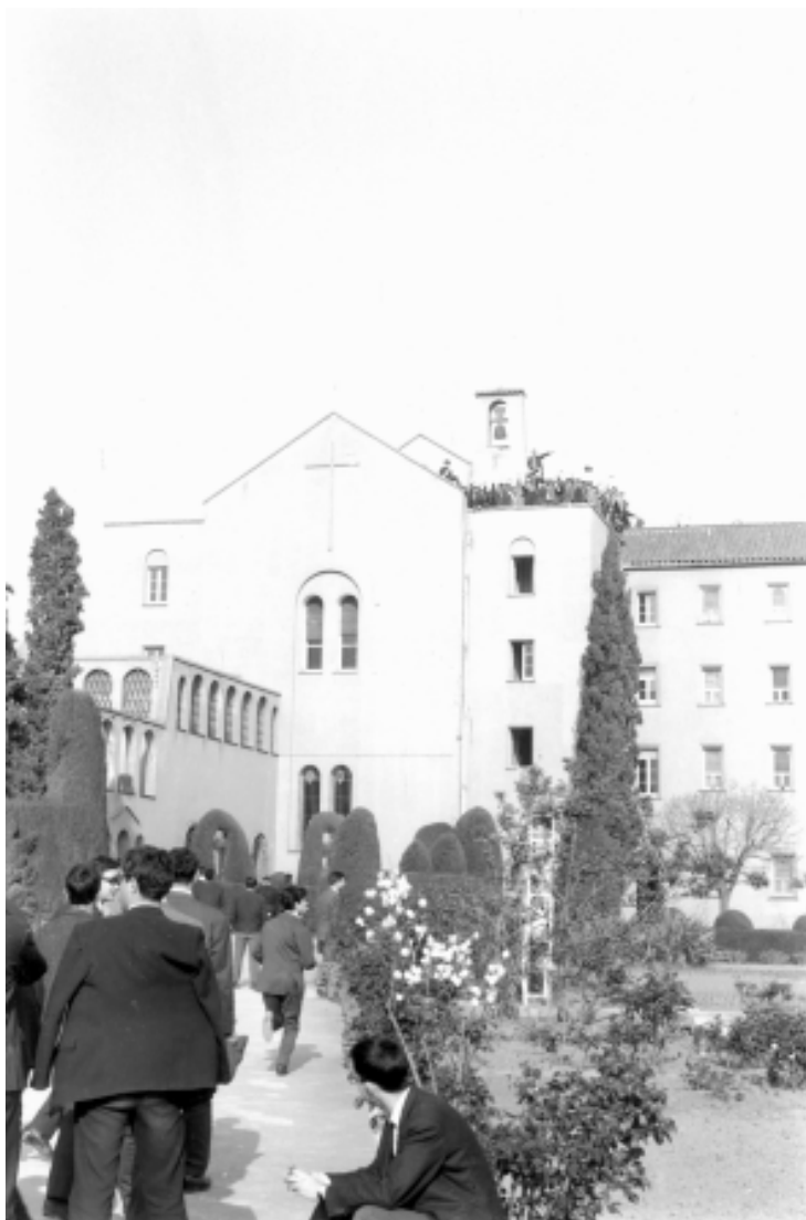
Vista panoràmica del convent dels pares caputxins de Sarrià.