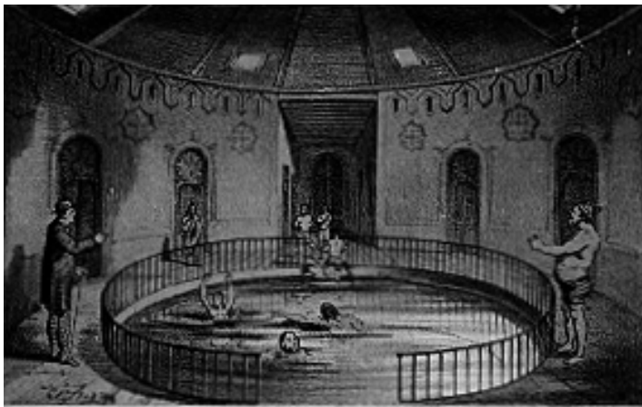
Vista de los baños generales con su piscina, en el Instituto, donde se bañan los Sres. pensionistas.

27-28. Des de la darrereria del segle XIX, la cultura física fou promoguda com a part essencial d'un règim de vida saludable. Aquestes escenes de gimnàstica i bany de pacients «pensionistes» al Manicomio de Sant Boi, prop de Barcelona, illustren el grau de penetració social de les noves tendències. Reproduccions d'A. Pujadas, El Manicomio de San Baudilio de Llobregat (Barcelona, 1877).