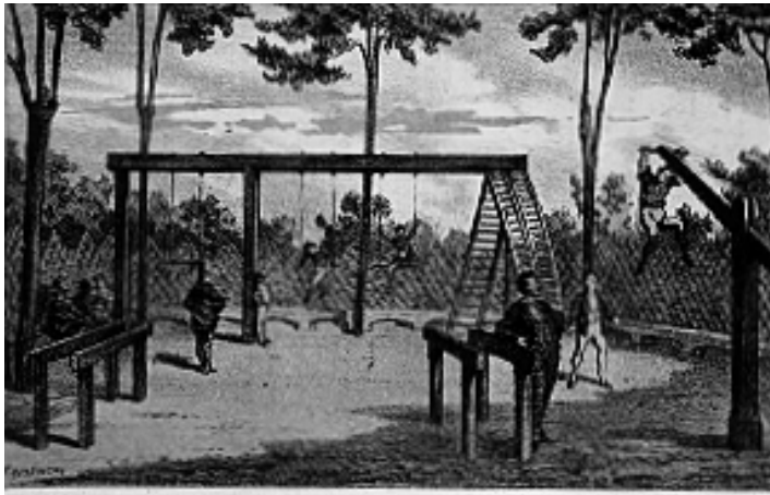
Vista del Gimnasio del Manicomio, en el que se ejercitan los Sres. enfermos.